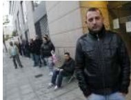
Denuncian la denegación "masiva" de nacionalidades