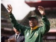
Cuatro millones de espectadores siguieron el biopic de Mandela