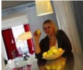
Megan Maxwell: "Si una mujer propone un trío a su marido, él se acojona"