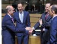
El Ecofin pide a España más reformas y más rápidas